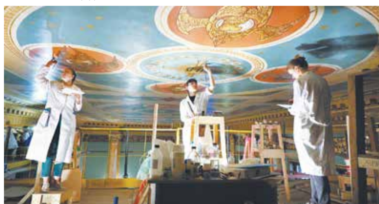
НОВАЯ ПЛОЩАДКА МУЗЫКАЛЬНОГО ТЕАТРА ИМ. Ф. И. ШАЛЯПИНА

КРОНШТАДСКИЙ РАЙОН. Завершён капитальный ремонт здания школы № 425; создан туристско-рекреационный кластер «Остров Фортков»; на территории Кронштадтского адмиралтейства принимает гостей военно-исторический парк. Украсили Кронштадт бульвар на улице Карла Маркса, скверы на Тулонской аллее и Цитадельском шоссе.