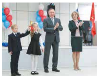
ШКОЛА № 434

В Выборгском районе в 2020 году принял ребятишек детский сад, строительство которого началось ещё в 2017-ом, а сроки окончания работ переносились 4 раза.