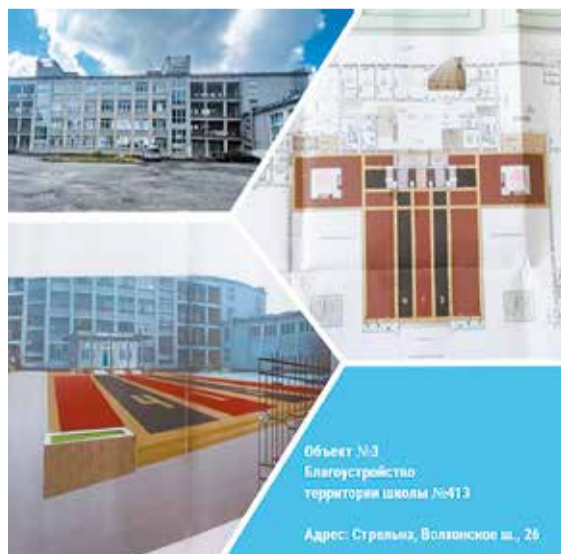
Объект №3 Благоустройство территории школы №413 Адрес: Стрельна, Волхонское ш., 26