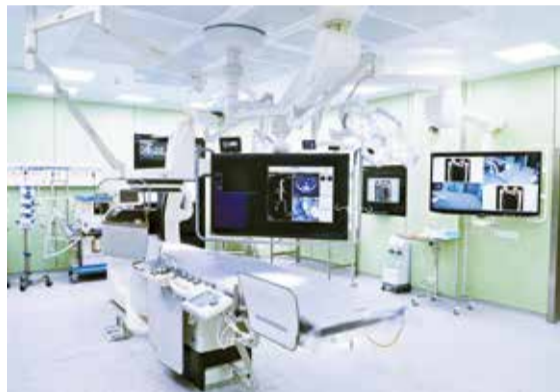
СОСУДИСТЫЙ ЦЕНТР В АЛЕКСАНДРОВСКОЙ БОЛЬНИЦЕ