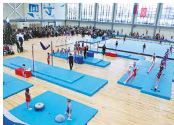
СПОР ПУШКИНСКОГО РАЙОНА

Кроме открытия спортшколы, значимым событием для жителей Пушкинского района стало начало работы ледовой арены «Пулково» и физкультурно-оздоровительного комплекса с бассейном. А ещё – строительство одной из самых больших в Питере школ на 1925 мест в посёлке Шушары. Там же было создано новое общественное пространство – сквер Николая Ивасюка.