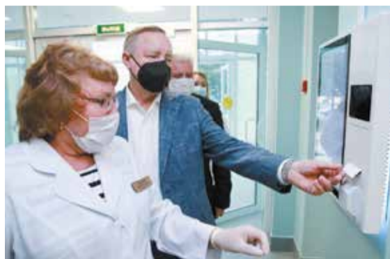
ПОЛИКЛИНИКА №125 В ПРИМОРСКОМ РАЙОНЕ