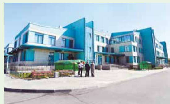
ПОЛИКЛИНИКА №122 В ПЕТРОДВОРЦОВОМ РАЙОНЕ

аварийных многоквартирных домов; открыта новая поликлиника в Стрельне, отремонтирована детская поликлиника в Петергофе; заработал молодёжный клуб «М-51» в Ломоносове.