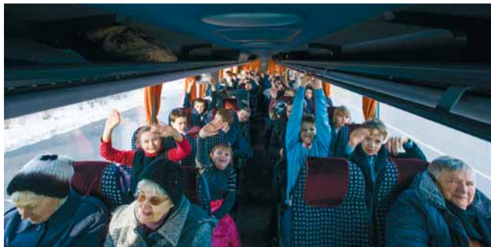
Местная администрация МО город Петергоф ежегодно организует экскурсионные поездки по памятным, историческим местам, в музеи, заповедники Северной столицы и Ленобласти для жителей Петергофа - детей и взрослых. В этом году в 22-х интереснейших экскурсиях приняли участие 990 человек.