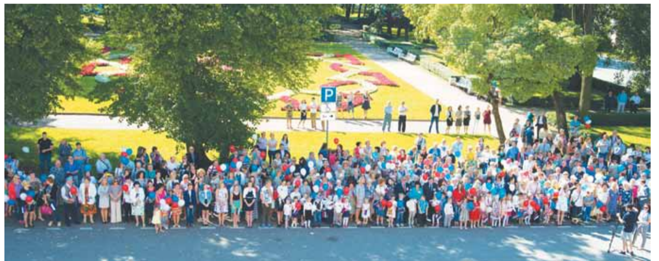
Фото с места встречи сторон